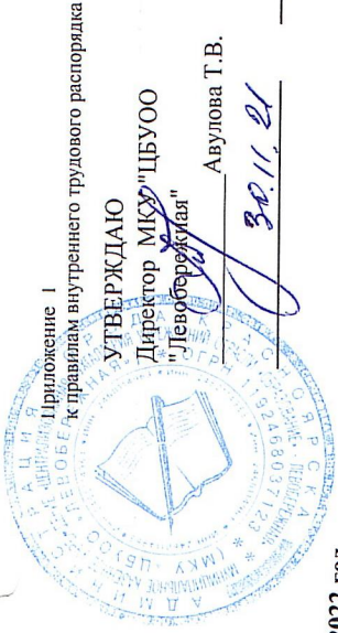
График работы при 28 часовой рабочей неделе на 2022 год